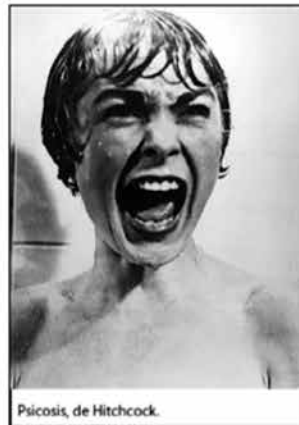
Psicosis, de Hitchcock.

Los realizadores del estudio sugieren que cuanto más largo es el salto entre el estreno de un film y sus subsiguientes referencias en otra película, más peso específico tiene a la hora de considerar su éxito a largo plazo. En el trabajo sólo incluyeron referencias realizadas 25 años después del lanzamiento de una película, para asegurarse de relevar influencias de largo término. De acuerdo con ese método, los títulos que produjeron influencias más duraderas en los años siguientes a su estreno son El mago de Oz, La guerra de las galaxias, Psicosis, Casablanca y Lo que el viento se llevó. El estudio analizó en la base de datos 42.794 citas que conectan una película con otra, como el diálogo sobre no querer estar con un